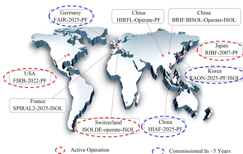
图3 用于不稳定核研究的新一代大科学装置 Fig.3 New-generation RIB facilities worldwide

现,这会推动新的理论框架的出现。实验探测装置也需要大大发展,特别是多粒子(包括多中子)和多碎片发射的符合测量,需要一系列新型探测技术和方法的支撑。