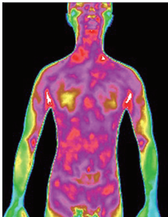
图 3 治疗后上腹部的红外温度