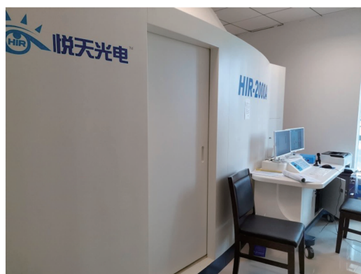
图 1 HIR2000A 红外热像诊断系统

依据《脾胃病症状量化标准专家共识意见(2017)》 [6] , 将 2 组患者治疗前后的主症和次症进行症候积分。选取胃痛、胃胀、呕吐、腹泻、畏寒、疲乏以及四肢无力等症状。每个症