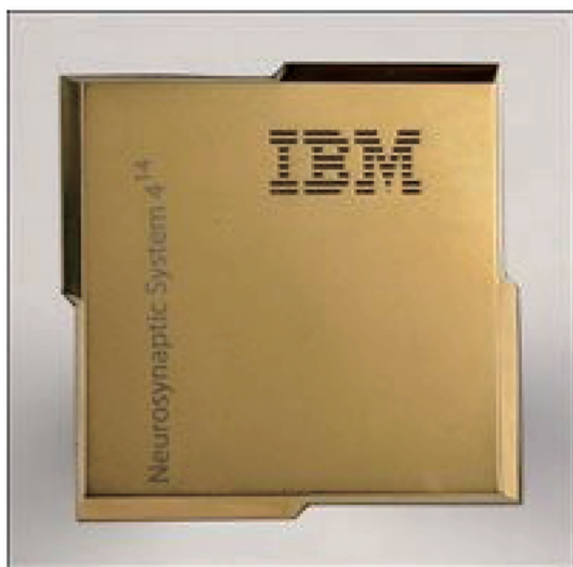
图 2 美国 IBM 公司的“真北”芯片

为应对冯·诺依曼架构存在的低智能、高能耗问题, 美国正在探索类脑计算等新型计算架构。类脑计算通过模拟神经网络架构实现高速并行计算, 以极低的硬件成本实现传统计算无法达到的智能水平。美国 IBM 公司开发出的“真北”芯片(见图 2)能够模拟 100 万个神经元和 2.56 亿个神经突触进行思考与学习, 其运行功耗仅为 70 mW, 比传统计算机低 4 个数量级。该芯片目前已用于超级计算机和机载目标识别研究, 未来有望大幅提高作战效能。