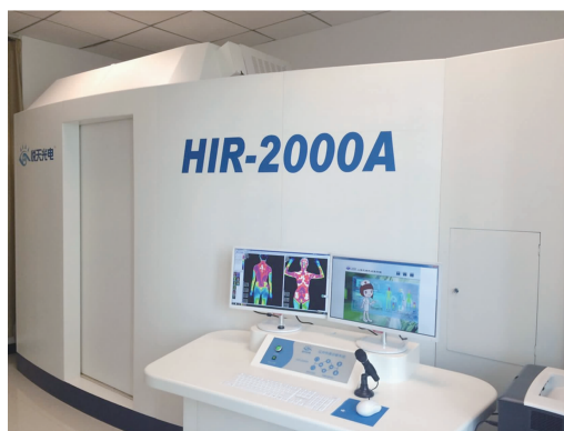
图 1 北京悦天光电有限公司生产的 HIR-2000A 红外热像仪

在前期大量基础及临床研究的基础上, 本文采用 HIR-2000A 红外热像仪(见图 1)观察了用附子桂枝汤治疗类风湿关节炎的 30 例患者的疗效。