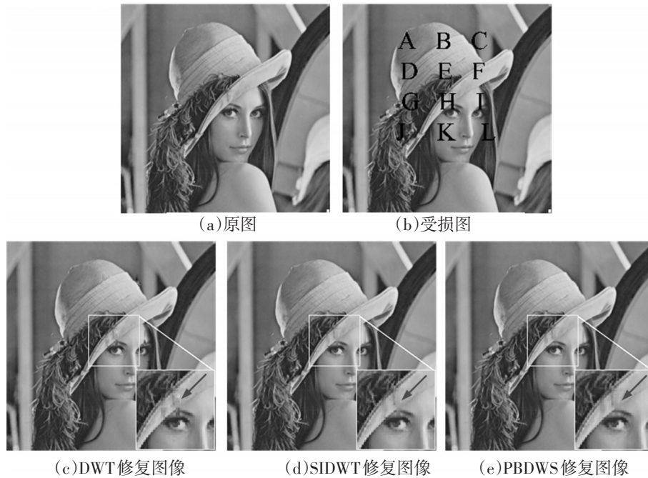
图3 Lena的文字掩码修复结果