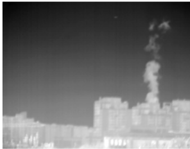
图1 低分辨率图像 Fig.1 Low-resolution image

过程未知,模糊核假设为高斯点扩展函数(Point Spread Function,PSF),其标准差采用IBD方法估计为 \sigma=0.36 ,空间上采样因子是2,正则化参量 \lambda=0.004 ,停止参量 \epsilon=0.0002 .图1~3分别是低分辨率图像,对低分辨率图像使用HMRF正则化重建和自适应HMRF正则化重建的图像效果.