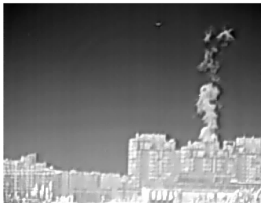
图3 自适应HMRF正则化重建 Fig.3 Adaptive HMRF construction

分析图1~3:低分辨率图像层次单一,细节模糊,弱小目标看不清楚(圆圈所示);图2(a)中梯度阈值 T=20 ,高频信号惩罚程度减小,图像细节恢复好,因噪音被过度放大,视觉效果差;图2(b)中梯度阈值 T=120 ,由于 T 取值偏大,过度惩罚了高频信号,图像细节损失严重;图3中梯度阈值根据数据项和正则项自适应调整,较好恢复细节信息的同时有效抑制了噪音,弱小目标清晰可辨.