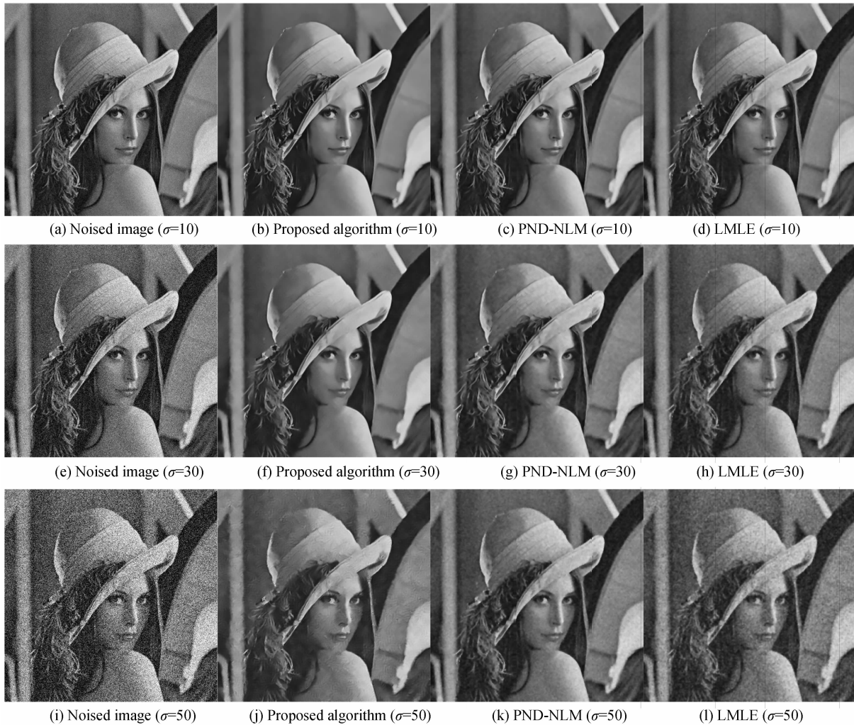
图 1 不同噪音等级本文算法、非局部均值算法和局部极大似然估计算法去噪结果