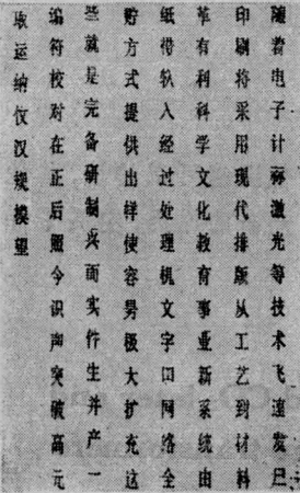
图 5 信息速率为 2 兆赫的字样

在上述实验系统中我们利用了 32 \times 32 点阵的汉字字形发生器进行了字形显示及记录实验。图 5 是文字信息的时钟频率为 2 兆